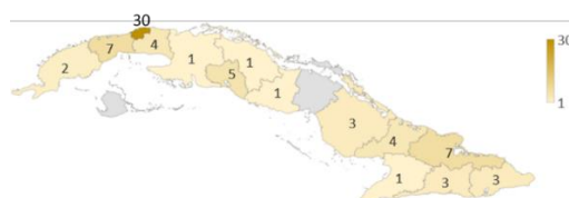
Figura 2. Ubicación de los estudiantes “en casa”

La inclusión en Cuba es una premisa en el desarrollo de la educación a todos los niveles y en este caso se destaca la participación en estos cursos, de estudiantes de 14 provincias, lo que también destaca las ventajas de la IaD en casa pues hay una diversa distribución geográfica de la matrícula, como se muestra en la Figura 2. La provincia de mayor representación es La Habana, que es también la más densamente poblada de Cuba.