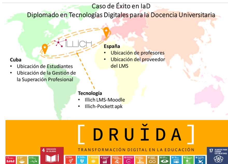
Figura 1. Los tres elementos de la IaD en la superación profesional en DRUIDA